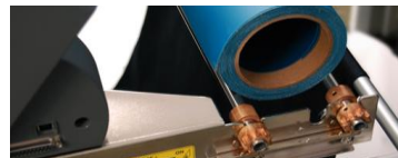
Supporto porta rotolo